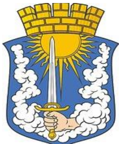
Герб Гвардейского муниципального округа

Гвардейский район был образован в составе Кенигсбергской области 7 апреля 1946 года. Законом Калининградской области от 10 июня 2014 года № 319 Гвардейское городское поселение, Знаменское сельское поселение, Зоринское сельское поселение, Озерковское сельское поселение и Славинское сельское поселение преобразованы путём их объединения во вновь образованное муниципальное образование, наделенное статусом городского округа, с наименованием «Гвардейский городской округ».