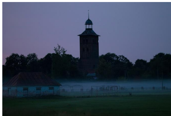
Стадион поселка Знаменск