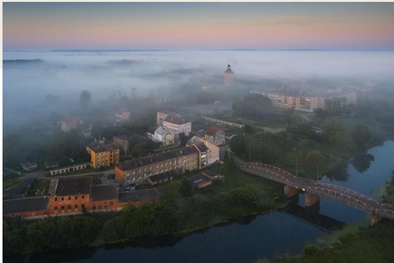
Туманное утро в Знаменске.