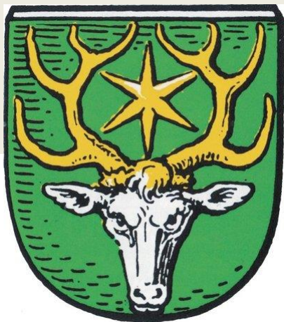
Герб поселка Знаменска до 1947 года