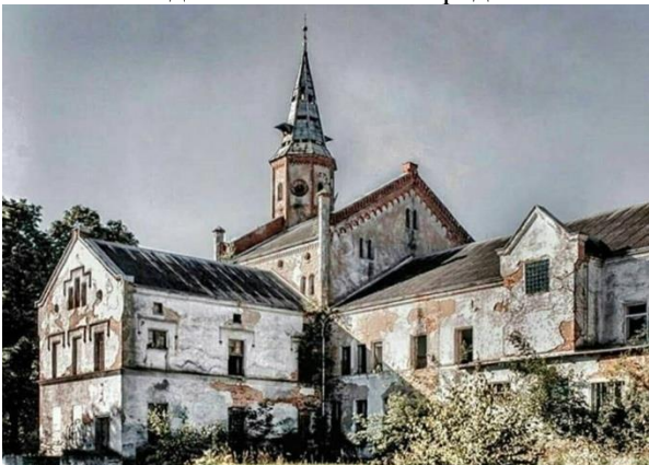
Психиатрическая больница «Алленберг»

Эту территорию можно привести в порядок за счет привлечения дополнительных средств инвесторов. Я уверена, что эти действия приведут к развитию туристического направления в посёлке, следовательно бюджет пополнится дополнительными средствами.