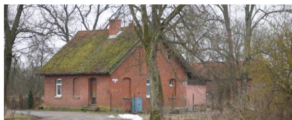
Магазин в поселке Гордое