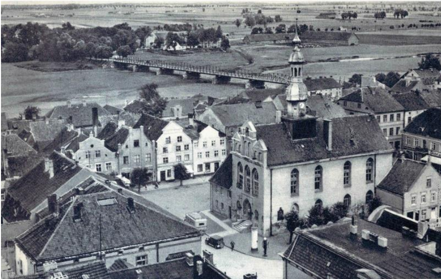
Велау 1932 год

Во время Второй мировой войны 23 января 1945 года Велау был взят Красной Армией. По решению Потсдамской конференции передан в состав СССР. С 1946 года посёлок городского типа Гвардейского района Калининградской области, с 2005 года — посёлок сельского типа в составе Знаменского сельского поселения.