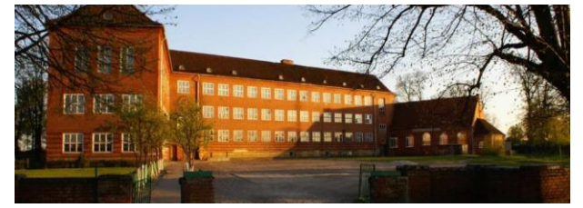
МБОУ «Средняя школа имени Героя России Александра Моисеева посёлка Знаменска Гвардейского муниципального округа Калининградской области»

Реальная гимназия, с середины 1930-х годов - "Немецкая орденская школа" (нем. Deutsch-Ordensschule), построена в Велау в 1929 год.